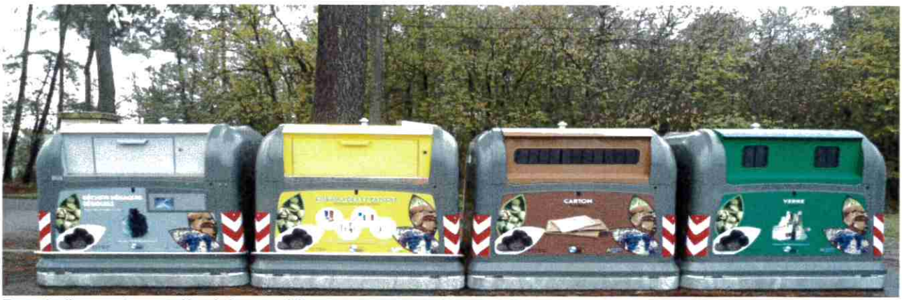
Exemple d'une station complète de bornes aériennes permettant le dépôt de 4 flux de déchets : les ordures ménagères, les recyclables, le carton, et le verre.